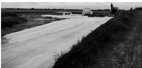
Nach dem Bau wurden die Außenanlagen neu gestaltet.

Mit dem Bau des Horizontalfilterbrunnens (Horibrunnen) im sogenannten „Paußnitzer Elbbogen“ nördlich von Strehla wurde bereits Ende 2014 begonnen. Bei dieser Sonderbauform eines Brunnens wird ein Betonschacht mit einem Durchmesser von drei Metern bis in eine Tiefe von 21 Metern abgesenkt. Einen Meter über der Sohle dieses Schachtes werden die Brunnenstränge, die eine Länge von je 20 Metern haben, horizontal in den Grundwasserleiter vorgetrieben. Das damit gewonnene Rohwasser wird über eine Ringleitung zwei Kreiselpumpen zugeführt, die es dann zur Aufbereitung in das Wasserwerk Fichtenberg befördern. Dort werden vorhandenes Eisen, Mangan und evtl. vorkommende Spurenstoffe entfernt, bevor es als Reinwasser in das Versorgungsnetz eingespeist wird.