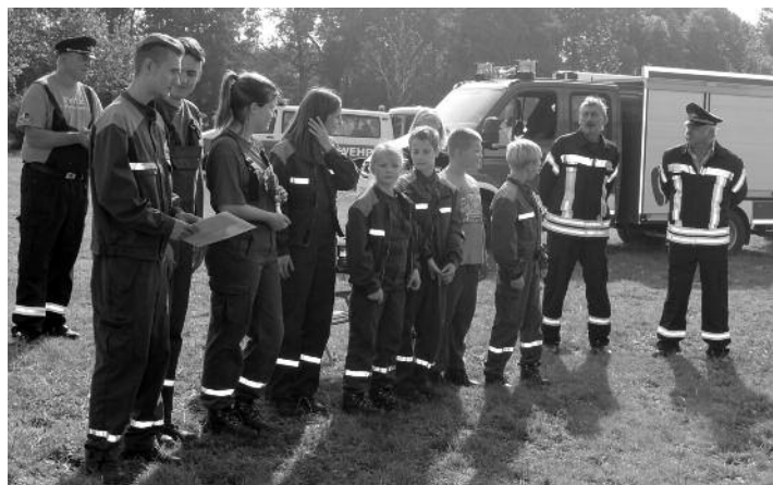
Unsere Jugendfeuerwehr mit einer hervorragenden Zeit von 50:00 Sekunden.

Meter über dem Boden befindet. In der Mitte der Zielscheibe ist eine fünf Zentimeter große Öffnung, hinter der ein Auffangbehälter mit 10 Liter Volumen befestigt ist. Bei einem Füllstand von zehn Litern wird ein Signal ausgelöst. Pro Wettkampfbahn sind für jede Mannschaft zwei Zielgeräte aufgestellt, deren Abstand voneinander 9,50 Meter beträgt. Die erreichte Zeit im Löschangriff ist für die Platzierung maßgebend. Als Sieger gingen die Kameraden von Baßlitz vom Platz, gefolgt von den Gastgebern aus Lenz sowie den Gävernitzer Kameraden.