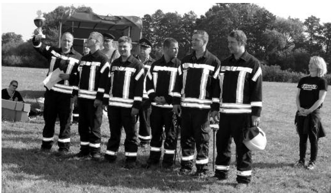
Sieger des diesjährigen Gemeindelöschangriffs – die Kameraden der OFw Baßlitz.

Eine Mannschaft beim Löschangriff Nass besteht aus sieben Teilnehmern, die in Feuerwehreinsatzbekleidung inklusive Helm, Koppel und Stiefeln antreten. Die Wettkampfbahn ist 95 Meter lang und 20 Meter breit. Neun Meter von den Seiten- und der Grundlinie entfernt befindet sich ein Holzpodest von 2 x 2 Metern Größe und maximal 10 Zentimetern Höhe, auf dem die Geräte abgelegt werden. Vier Meter links von der linken Kante des Holzpodestes befindet sich als Wasserentnahmestelle ein offener viereckiger Behälter mit mindestens 1.000 Litern Fassungsvermögen. Die Angriffslinie befindet sich 90 Meter von der Startlinie und damit fünf Meter von den Zielgeräten entfernt. Diese bestehen aus einer 50 x 50 Zentimeter großen Zielscheibe, deren Unterkante sich 1,45