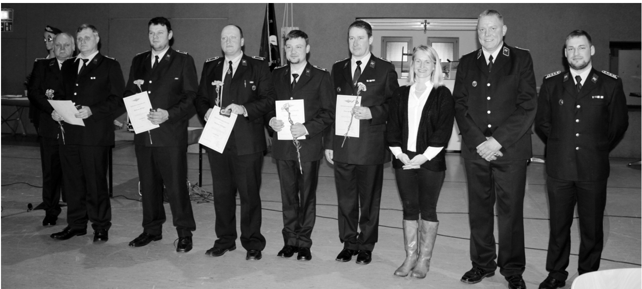
Beförderung von Kameraden zum Löschmeister.