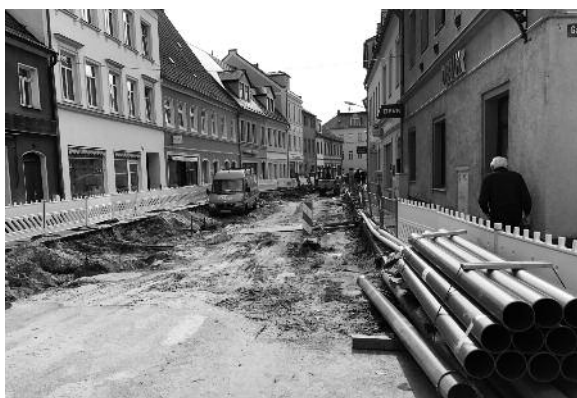
In der Berliner Straße werden alte Rohre ersetzt.

Im Zuge der Baumaßnahmen der Deutschen Bahn an der Bahnstrecke Dresden-Berlin wurden im I. Quartal 2017 eine Bahnkreuzung im Bereich der Großraschützer Straße neu gebaut und die Bahnkreuzung in der Parkstraße umverlegt.