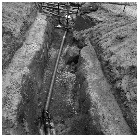
Umfangreiche Arbeiten erfolgten am Trinkwassernetz in Cunnersdorf.

In Fortführung des grundhaften Straßenausbaus der K 8516 in Cunnersdorf wurden 2017 weitere Arbeiten am Trinkwassernetz ausgeführt. Im vergangenen Jahr wurden in den Nebenbereichen Hausanschlussleitungen ausgewechselt und alte Leitungen außer Betrieb genommen. Im Baubereich vom Ortseingang Cunnersdorf bis zur Röder wurde ein Knotenpunkt ausgewechselt und damit der neuen Straße angepasst.