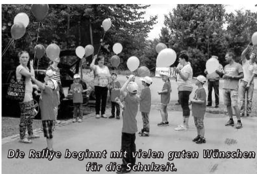
Die Rallye beginnt mit vielen guten Wünschen für die Schulzeit.

Nach einer kurzen Mittagsruhe ging es ab mit der Feuerwehr. Ziel der Fahrt war der Sportplatz im Großenhainer Stadtpark. Dort warteten schon die Eltern ganz ungeduldig auf ihre Kinder. Nach einer kleinen Stärkung machten wir uns auf zur Zuckertütenrallye quer durch den Stadtpark. Es gab die verschiedensten Aufgaben: Zuckertütenzielweitwurf, die Kinder mussten erraten was in eine Zuckertüte bzw. in einen Schulranzen gehört, Geschicklichkeit war gefragt und vieles mehr. Ziel der Rallye war der Spielplatz. Dort wartete die schwerste Aufgabe auf unsere Schulanfänger. Jeder musste seine Zuckertüte erklettern. Zum Abschluss saßen alle noch beisammen in einer gemütlichen Grill- und Plauderrunde. Wir danken allen für die riesengroße Unterstützung bei der Vorbereitung und Durchführung dieses tollen Tages.