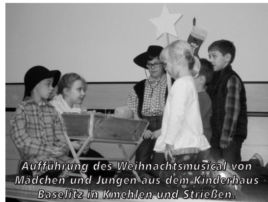
Aufführung des Weihnachtsmusical von Mädchen und Jungen aus dem Kinderhaus Baselitz in Kmehlen und Strießen.

Dafür sagen wir herzlich Danke allen Helfern.