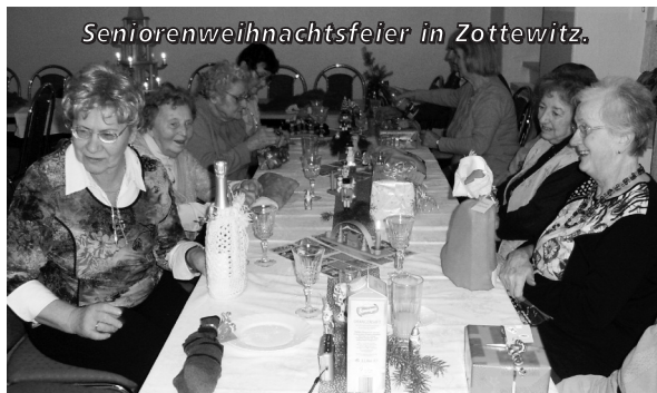
Seniorenweihnachtsfeier in Zottewitz.