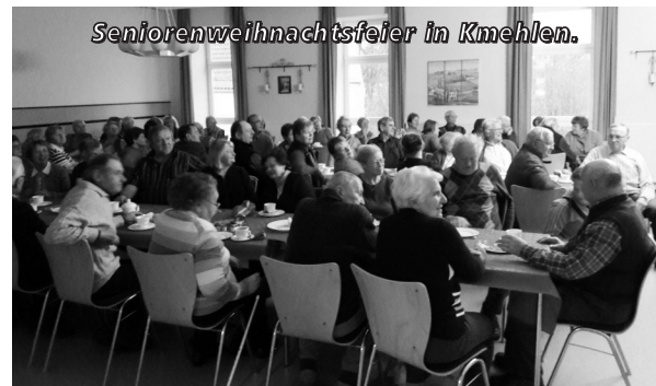
Seniorenweihnachtsfeier in Kmehlen.