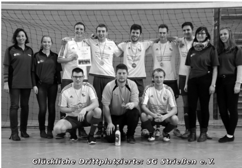
Glückliche Drittplatzierte: SG Strießen e.V.

Glückwunsch geht hierbei auch an Gigapudding, die den Titel verdient gewonnen haben. Es war wieder ein Spaß und gutes Miteinander mit ALLEN beteiligten Teams.