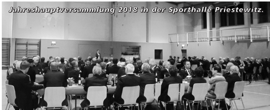
Jahreshauptversammlung 2018 in der Sporthalle Priestewitz.

Um den Kameraden einmal aufrichtig zu danken und eine Bilanz über das vergangene Jahr zu ziehen fand am 02.02.2018 in unserer Sporthalle Priestewitz die jährliche Hauptversammlung der Freiwilligen Feuerwehr Priestewitz statt. Diese bot Gelegenheit zur Rückschau auf ein arbeitsintensives Jahr unserer Ortsfeuerwehren. Die anwesenden Kameradinnen und Kameraden sowie Gäste erhielten durch unsere Wehrleiter und unseren Jugendwart einen Überblick über die Einsätze, Dienste und Aktivitäten der einzelnen Ortsfeuerwehren und der Jugendfeuerwehr. Es gab Gelegenheit zum fachlichen Austausch und gegenseitigem Kennenlernen. Insbesondere die neu aufgenommenen Kameraden konnten in diesem Rahmen vorgestellt werden. Denn auch in unserer Freiwilligen Feuerwehr