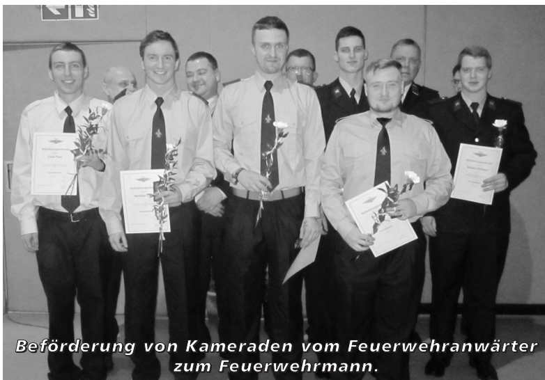
Beförderung von Kameraden vom Feuerwehranwärter zum Feuerwehrmann.

Um den Kameraden einmal aufrichtig zu danken und eine Bilanz über das vergangene Jahr zu ziehen fand am 02.02.2018 in unserer Sporthalle Priestewitz die jährliche Hauptversammlung der Freiwilligen Feuerwehr Priestewitz statt. Diese bot Gelegenheit zur Rückschau auf ein arbeitsintensives Jahr unserer Ortsfeuerwehren. Die anwesenden Kameradinnen und Kameraden sowie Gäste erhielten durch unsere Wehrleiter und unseren Jugendwart einen Überblick über die Einsätze, Dienste und Aktivitäten der einzelnen Ortsfeuerwehren und der Jugendfeuerwehr. Es gab Gelegenheit zum fachlichen Austausch und gegenseitigem Kennenlernen. Insbesondere die neu aufgenommenen Kameraden konnten in diesem Rahmen vorgestellt werden. Denn auch in unserer Freiwilligen Feuerwehr