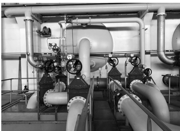
Die Filterarmaturen im Wasserwerk Fichtenberg werden erneuert.

Das Wasserwerk Fichtenberg in der Gemeinde Mühlberg ist das größte und bedeutendste Wasserwerk der Wasserversorgung Riesa-Großenhain GmbH. Seine fünf Filteranlagen sind seit Inbetriebnahme des Werkes vor ca. 40 Jahren rund um die Uhr in Betrieb und noch mit den Originalfilterarmaturen mit Durchmessern von bis zu 40 cm ausgestattet. Die Großarmaturen weisen nun deutliche Verschleißerscheinungen – teilweise auch Undichtigkeiten – auf.