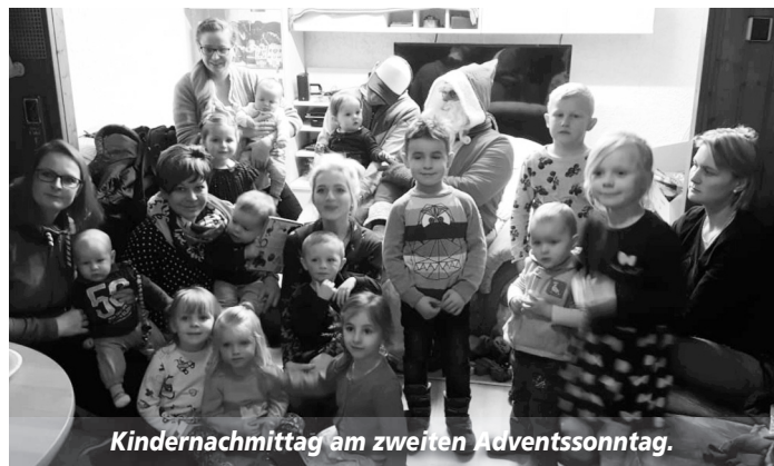
Kindernachmittag am zweiten Adventssonntag.