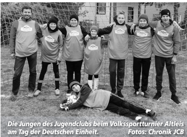
Die Jungen des Jugendclubs beim Volkssportturnier Altleis am Tag der Deutschen Einheit.