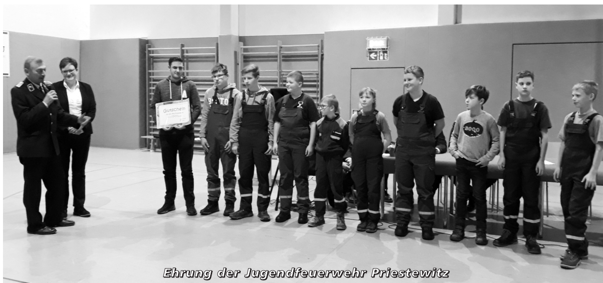
Ehrung der Jugendfeuerwehr Priestewitz