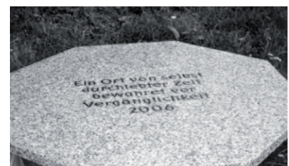
„Ein Ort von selbst durchlebter Zeit bewahrt von Vergänglichkeit 2006“