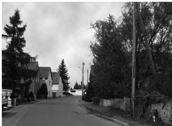
Kreisstraße 8554, Ortslage Zottewitz