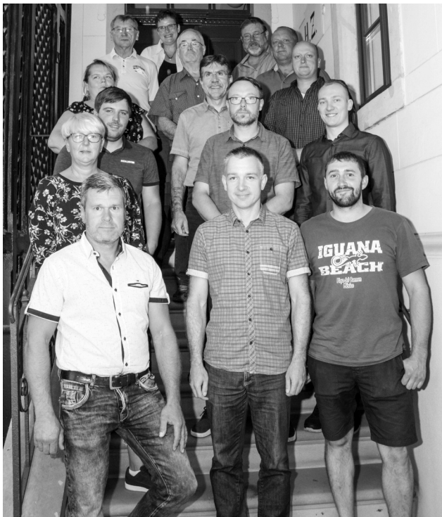
Unser Gemeinderat zur konstituierenden Sitzung am 07.08.2019.

Nach Feststellung der Gültigkeit der Gemeinderatswahl vom 26. Mai 2019 durch das Rechts- und Kommunalamt des Landratsamtes Meißen konnte unser neuer Gemeinderat am 07.08.2019 seine Arbeit aufnehmen. In dieser ersten Sitzung wurden nach der Verpflichtung zur gewissenhaften Aufgabenerfüllung im Interesse der Gemeinde u. a. die Stellvertreter der Bürgermeisterin gewählt sowie die Mitglieder der einzelnen Gremien bestellt (siehe Beschlüsse). Für die Bereitschaft der Übernahme zusätzlicher Aufgaben nochmals vielen Dank.