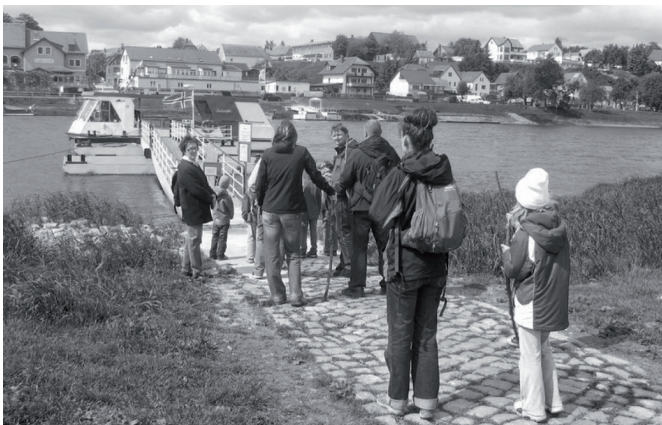
Erste Familienwanderung des Kinderhauses Villa Kunterbunt am 12. Mai 2012. Ziel war der Tierpark Hebele