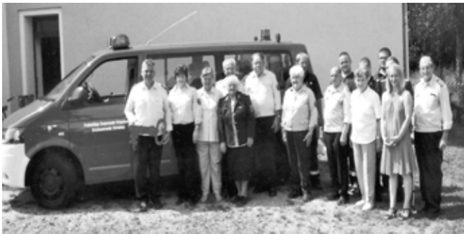
Kameradinnen und Kameraden der OFW Strießen und Bürgermeisterin vor ihrem neuen Feuerwehrfahrzeug