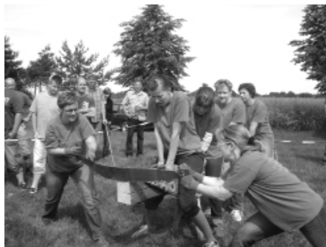
Frauenmannschaft aus Böhla

mit der Mannschaft aus Nauleis. Der Sieger bei diesem Wettstreit war der Jugendclub Böhla. Nur die Männer aus Böhla müssen noch etwas üben.