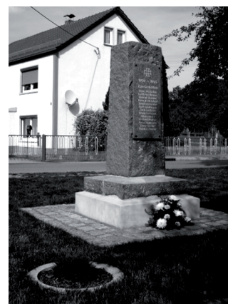
Einweihung der Gedenktafel

Großenhain, Klostersgasse 8 ☎ (0 35 22) 50 91 01 www.krematorium-meissen.de Riesa, (Weida) Stendaler Str. 20 ☎ (0 35 25) 73 73 30 Meißen, Nossener Str. 38 ☎ (0 35 21) 45 20 77 Nossen, Bahnhofstr. 15 ☎ (03 52 42) 7 10 06 Weinböhla, Hauptstr. 15 ☎ (03 52 43) 3 29 63 Radebeul, Meißner Str. 134 ☎ (03 51) 8 95 19 17