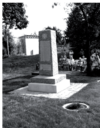
Denkmal am Strießener Weg