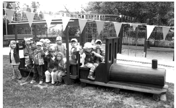
Pünktlich zum Kindertag nahm auch die neu nachgebaute Lok ihren alten Platz im Garten wieder ein ...

In unserer Gartenanlage ist ein Kleingarten zu vergeben. Interessenten melden sich bitte bei: Frau Meinel, 01561 Priestewitz, Kottewitzer Straße 1, Telefon: 03522/507858