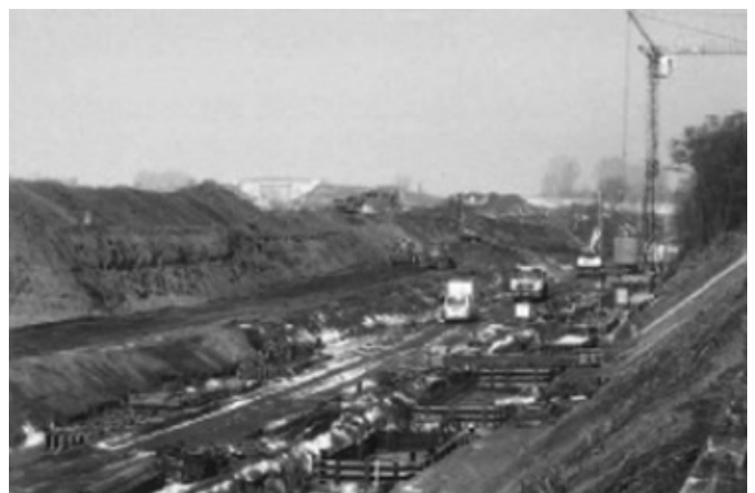
Bau des Kreuzungsbauwerkes Kottewitz

Neuordnung der Gleise für einen getrennten Betrieb von S-Bahn, Fern- und Regionalverkehr; Erneuerung der Ingenieurbauwerke und Bahnsteiganlagen, Ausrüstung mit elektronischer Stellwerkstechnik.