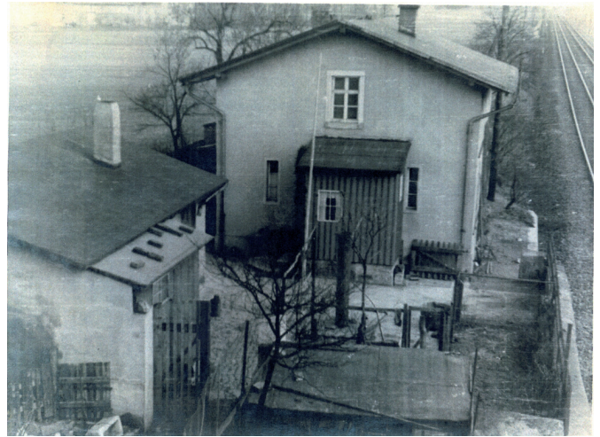
Das Foto zeigt das Bahnhof neben der Brücke. Im hinteren Teil des Hauses befand sich der Dienstraum mit Ausgang zum Gleis zur Bedienung der Schranken (Blick von der Brücke).