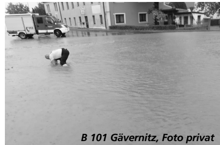
B 101 Gävernitz

Aber bitte nicht so, wie es am Freitag, dem 14.08.2020, in Piskowitz/Gävernitz/ Baßlitz und am Dienstag, dem 18.08.2020, in Strießen/Priestewitz/Stauda passierte. Hier mussten innerhalb kürzester Zeit teilweise 48 Liter Regen verkraftet werden. Straßen wurden überflutet, einige Grundstücksbesitzer mussten zum Teil erhebliche Schäden durch Wasser und vor allem Schlamm verzeichnen. Diese konnten auch unsere sofort zur Hilfe geeilten Kameraden der Ortsfeuerwehren Baßlitz, Gävernitz, Strießen, Priestewitz und Zottewitz mit Stützpunkt Blattersleben nicht gänzlich verhindern, jedoch wenigstens etwas minimieren.