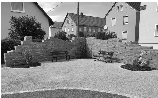
Foto kleiner Dorfplatz Priestewitz Wiesenweg, August 2020

Möglich wurde diese Maßnahme Dank der 80%-igen Zuwendung, welche die Gemeinde Priestewitz über den Dresdner Heidebogen e.V. beantragt und als Förderung eines Kleinprojektes bis 12.500 EUR Gesamtkosten über das „Regionalbudget 2020“ erhalten hat. Die Umsetzung der Maßnahme erfolgte durch die Landschaftsbau Kauer GmbH aus Neuseußlitz.