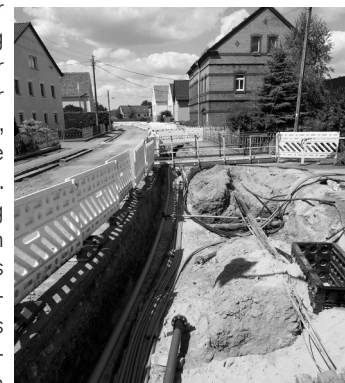
Die Neuverlegung der Trinkwasserleitung in der Königsbrücker Straße.

Die Versorgung der Grundstücke entlang der Königsbrücker Straße erfolgt über Trinkwasserleitungen, die über private Flurstücke verlaufen. Die Trinkwasserleitung ist in einem schlechten Zustand, was bereits durch einen Rohrbruch unterhalb eines Gebäudes der offenkundig wurde. Im Zusammenhang mit einer Straßenbaumaßnahme des LASUV wurde kurzfristig entschieden, ca. 300 m Leitung der Dimension PE d 110 neu zu verlegen. Innerhalb der Königsbrücker Straße stabilisiert diese das Versorgungsnetz in Schönfeld und erhöht die Versorgungssicherheit in diesem Bereich.