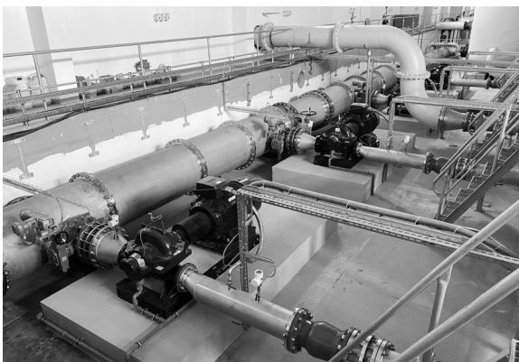
Im Wasserwerk Fichtenberg wurden in den Jahren 2019/2020 die Reinwasserpumpen und der Saugkollektor erneuert. 2020 erfolgt die letzte Teilmaßnahme als „Los 5“.

Im Wasserwerk Fichtenberg in der Stadt Mühlberg wurde im Jahr 2019 mit dem Umbau des Saugkollektors für die Reinwasserpumpen begonnen. 2020 soll mit dem Los 5 die planmäßige Weiterführung sowie der Abschluss der Maßnahme erfolgen. Dieses Los umfasst den Rückbau des erdverlegten „Altkollektors“, den Abriss eines Schachtes, den Verschluss von fünf Wanddurchführungen unterschiedlicher Dimensionen sowie die Rückumbindung der abgehenden Trinkwasserfernleitung DN 800, wobei ein während der Bauzeit installiertes Provisorium beseitigt wird. Diese Maßnahme kostet voraussichtlich 60.000 Euro.