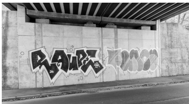
Leider eine von vielen Brücken mit Graffiti im Gemeindegebiet: Brücke in Geißlitz