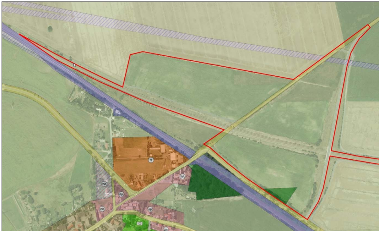
Abb. 2: Auszug aus dem wirksamen Flächennutzungsplan für den westlichen Bereich

Im wirksamen Flächennutzungsplan der Gemeinde Strießen (seit 01.01.1999 Gemeinde Priestewitz) ist der Änderungsbereich für die geplante Photovoltaikanlage, für den geänderten Verlauf der Kreisstraße und für die Neubaustrecke Weißig-Böhla als Fläche für die Landwirtschaft dargestellt, ein kleiner Teil (ehemaliger Verlauf der K 8550) ist als Verkehrsfläche dargestellt. Im südlichen Teilbereich der geplanten Anlage ist ein kleiner Teil als Waldfläche dargestellt.