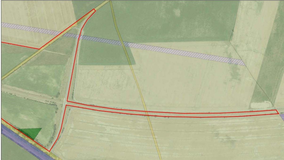
Abb. 3: Auszug aus dem wirksamen Flächennutzungsplan für den östlichen Bereich