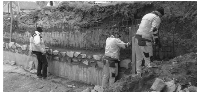
Mitarbeiter des Bauhofes Priestewitz beim Wiederaufbau der Rittergutsmauer in Zottewitz.

Rittergutsmauer eingestürzt. Diese Mauer steht unter Denkmalschutz. Sie ist Teil der im 17. Jahrhundert angelegten über zwei Meter hohen Bruchsteinmauer, welche das ehemalige Rittergut umschloss. Die Gemeinde leistet nun der denkmalrechtlich Anordnung Folge und baut die Mauer wieder auf. Nach Abschluss dieses Mauerbaus und Abnahme durch die Denkmalschutzbehörde kann die davor frei gewordene Fläche für die Spielplatzgeräte vorbereitet werden. Die entsprechende Ausschreibung für die Spielgeräte läuft bereits.