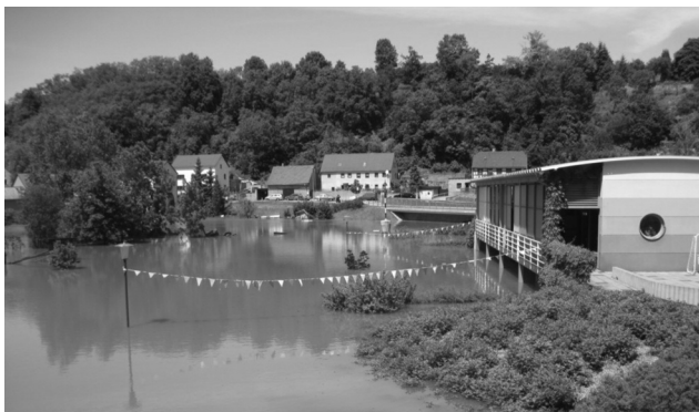
Kita MS Sonnenschein Zehren – Hochwasser 2013

Mit dem inzwischen 13. Fest unter dem Motto „Tierisch, tierisch“ starten wir gemeinsam in den Sommer und die Urlaubssaison. Unsere Großen haben wir feierlich verabschiedet. Sie haben nach einem aufregenden Abend in der Villa übernachtet.