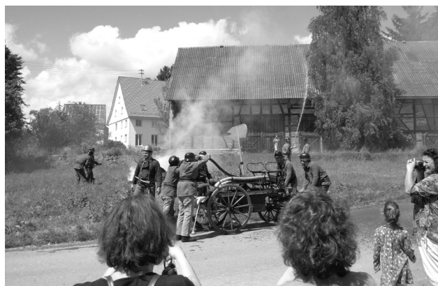
Freiwillige Feuerwehr 1920 (nachgestellt)