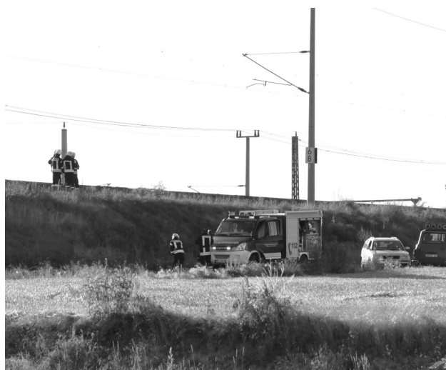
Kameraden der Ortsfeuerwehren Baßlitz, Gävernitz und Lenz im Einsatz am Bahndamm

Dem schnellen Handeln und der großen Einsatzbereitschaft der Kameraden war es trotz großer Hitze zu verdanken, dass diese Brände nicht auf die umliegenden Felder übergriffen.