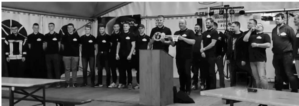
Schlüsselübergabe zum Festakt am Freitagabend.

Die Gratulanten schlossen sich an und die Freude war den älteren und jüngeren Mitgliedern deutlich anzusehen.