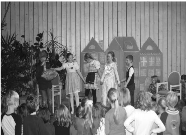
Aufführung: „Die Goldene Gans“ der 3.Klassen