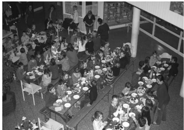
Frühstück nach einer langen Nacht

Danke an alle Lehrer, Schüler, fleißigen Helfer, dem Förderverein und einem anonymen Spender!