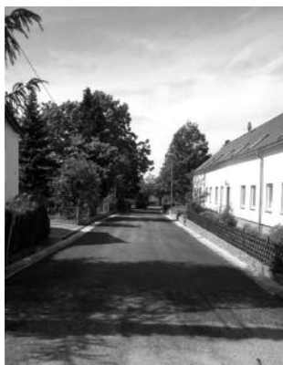
Baselitz – An der Linde

Über die Verordnung des Staatsministerium für Wirtschaft, Arbeit und Verkehr zur Beseitigung von Schäden des Winters 2012/2013 an Straßen hat die Gemeinde folgende zwei Instandsetzungsleistungen in Form einer Decklagenverstärkung im Mai 2014 umgesetzt und bereits abgeschlossen: Baselitz - An der Linde (Bild 1) und Böhla Bahnhof - Am Sportplatz (Bild 2). Die Winterschadensbeseitigung ist ein Fördermaßnahme. Die geplanten Kosten beliefen sich auf 30.600 €, An der Linde und 54.400 €, Am Sportplatz. Die stark schwankenden Ausschreibungsergebnisse sowie die örtlichen Gegebenheiten wie Beschaffenheit des Untergrundes oder des Regenwasserkanals insbesondere in Baselitz verursachten eine Verschiebung in den ausgeschriebenen Kostengruppen selbst. Nach vorläufiger Schätzung ist eine Kostendeckende Gesamtabrechnung zu diesen Maßnahmen zu erwarten.