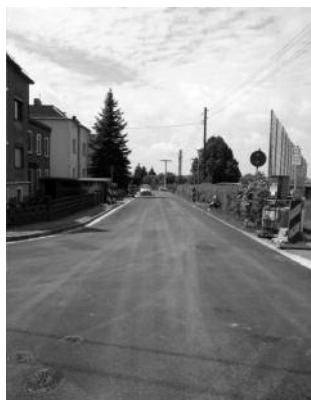
Böhla Bahnhof – Am Sportplatz