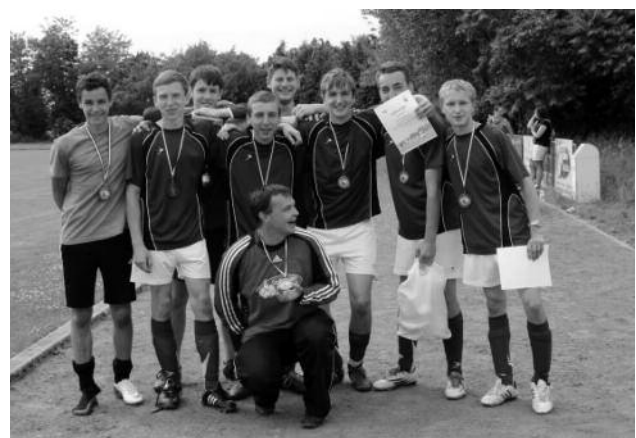
SG Strießen 07: Bronzemedaillegewinner und Organisatoren