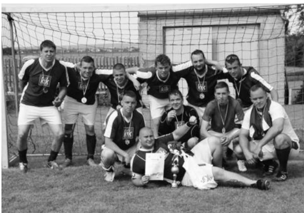
Die Gewinnermannschaft: Motorsuhl aus Nünchritz

SG Strießen 07, Mobile Jugendarbeit Großenhain & Priestewitz