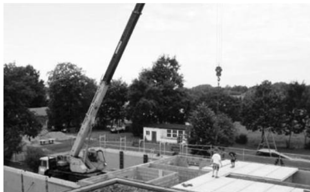
24.7.2014 Verlegung der Dachdecke auf dem Sozialtrakt

Mit Beginn der 1. Juliwoche erfolgte das Anlegen des Ziegelmauerwerkes und am 24.7.2014 wurde bereits die Betondachdecke über dem Sozialtrakt verlegt.