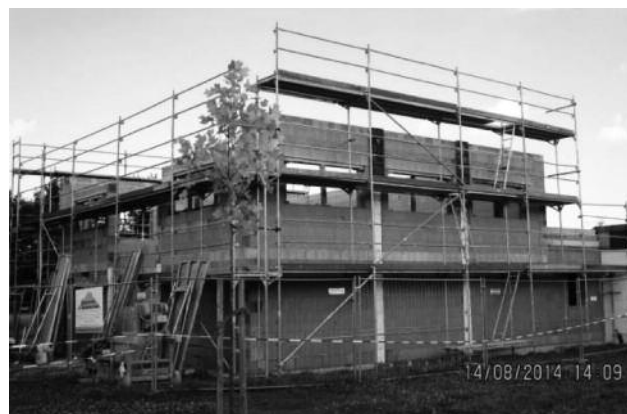
14.8.2014 Mauerwerk für den Turnmehrzweckraum

Die Folgegewerke wie Zimmerer, Putzer, Dachdecker, Elektroinstallation sowie für die Heizung/Sanitär und Lüftungstechnik sind bereits vom Objektplaner der Grundplan Architektur & Statik GmbH und den jeweiligen Fachplanern ausgeschrieben und vom Gemeinderat vergeben. Damit steht einem weiteren zügigen Bauablauf nichts entgegen.