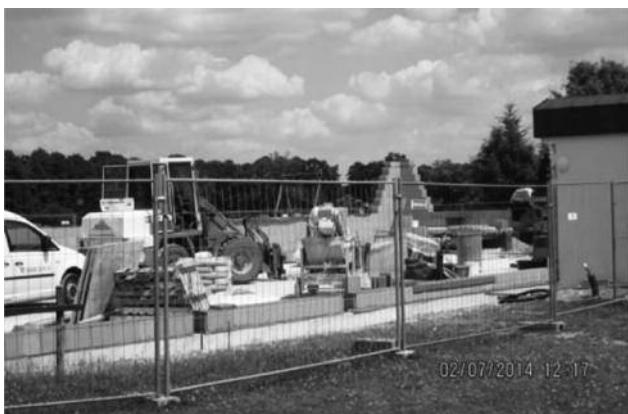
2.7.2014 Anlegen des Mauerwerkes auf der Bodenplatte

Danach erfolgte der ca. 5,75 m hohe Rohbau für den Turnmehrzweckraum, auf welchem Ende August die spätere Dachbinderkonstruktion aufgelegt werden soll. Die Maurerarbeiten umfassen ca. 150 m 3 Mauerwerk sowie ca. 150 lfdm Ringankerausbildung mit bewehrtem Beton.