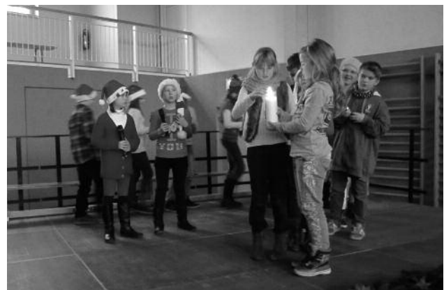
Vorführung des Weihnachtsmusicals von Kindern der GS Lenz in Priestewitz