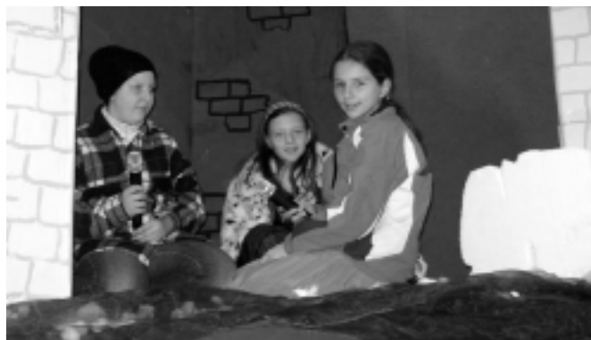
Gerda und Kai