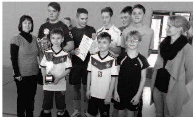
Sieger: Truppe von Lichtensee/Wülknitz

Die Vorrunde überstand die Mannschaft schadlos, alle Spiele wurden und ohne Gegentor gewonnen. Nach harten aber siegreichen Kämpfen im Halbfinale standen sich im Finale Lichtensee/Wülknitz und Priestewitz gegenüber. In einem umkämpften Spiel ging der Sieg denkbar knapp an die Truppe von Lichtensee/Wülknitz. Unser 2. Platz berechtigt uns für die Teilnahme an der Endrunde in Weinböhla. Herzlichen Glückwunsch und alles Gute für diesen Wettkampf!