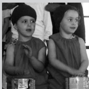
Aufführung der Kindermusicals