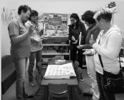
Führung durch das Kinderhaus

20 Jahre, auf die wir gern und auch ein bisschen mit Stolz zurückblicken können. Durch mehrere Baumaßnahmen und Sanierungen konnten sehr gute räumliche und pädagogische Voraussetzungen für einen freudvollen Aufenthalt unserer Kinder und eine gute Lernatmosphäre geschaffen werden. Der Rückblick in das Gründungsjahr 1995 ließ viele Erinnerungen wach werden. Mutige Eltern gründeten gemeinsam mit dem Kita-Team den Verein Miteinander unter dem Vorsitz von Gero Stolle und übernahmen die Trägerschaft des Kinderhauses. Rückschau zu halten und dieses Jubiläum zu feiern wurde vom Gründungsvorstand angeregt. Eine gute Entscheidung – am 30. Mai war es dann soweit.