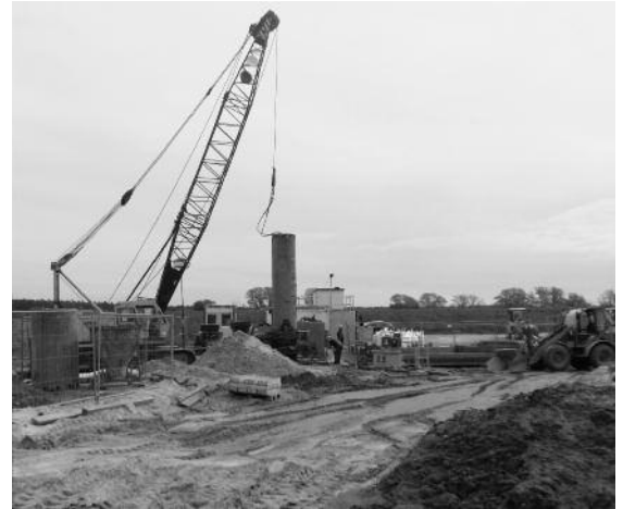
Ein Seilbagger im Einsatz bei den Kiesaustauschbohrungen.

Das Gesamtbauwerk soll voraussichtlich Anfang 2016 in Betrieb genommen werden. Der Wertumfang des Gesamtvorhabens beträgt in 2015 ca. 2,1 Mio. Euro.