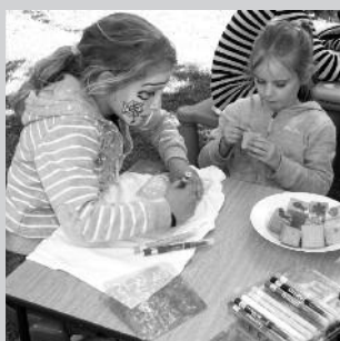
Kinder beim Malen