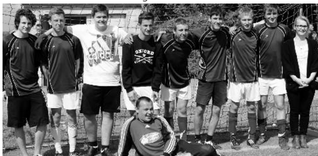
SG Strießen 07

Mobile Jugendarbeit Großenhain & Priestewitz