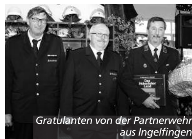
Gratulanten von der Partnerwehr aus Ingelfingen