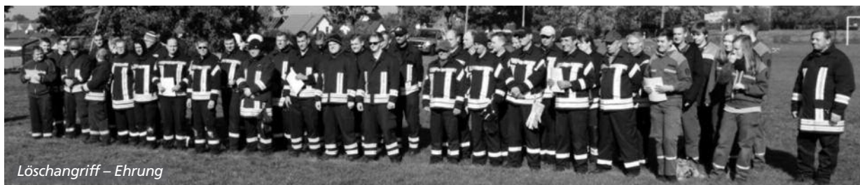
Löschangriff – Ehrung