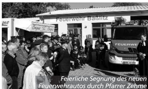
Feierliche Segnung des neuen Feuerwehrautos durch Pfarrer Zehme