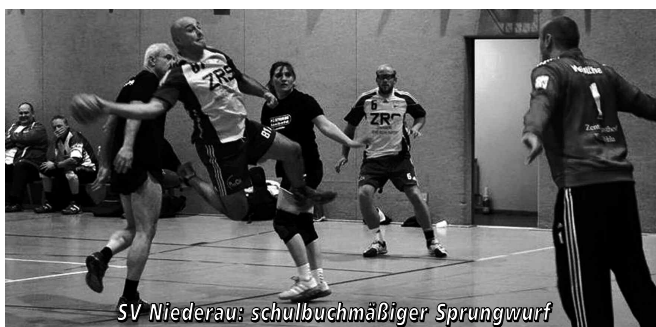
SV Niederau: schulbuchmäßiger Sprungwurf