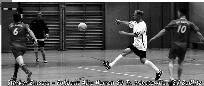
Starker Einsatz - Fußball: Alte Herren SV Tr. Priestewitz - SV Baßlitz

Es war ein absolut gelungener Abend in der Sporthalle Priestewitz. Die Verpflegung war spitze, die Zuschauer sahen tolle Wettkämpfe und das Wichtigste: Es wurde genügend für unsere Kinder gespendet.